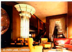
45 PARK LAINE, LONDRES

Rodeado de viñedos, a sólo 10 minutos de St Tropez, en este boutique hotel de 15 habitaciones gobiernan el estilo y el servicio. Creado por los