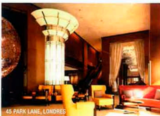
45 PARK LAINE, LONDRES

Rodeado de viñedos, a sólo 10 minutos de St Tropez, en este boutique hotel de 15 habitaciones gobiernan el estilo y el servicio. Creado por los